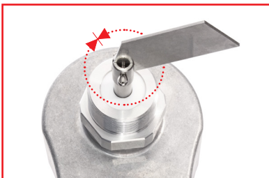
Rotation um 360° Grad mit Drehrichtungswechsel