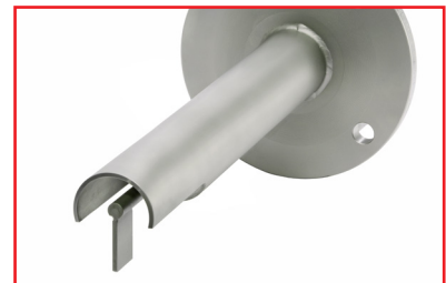
Robustes, integriertes Schutzdach