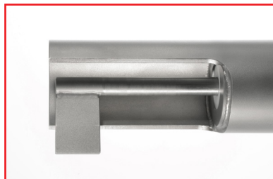
Flügel und Welle geschweißt